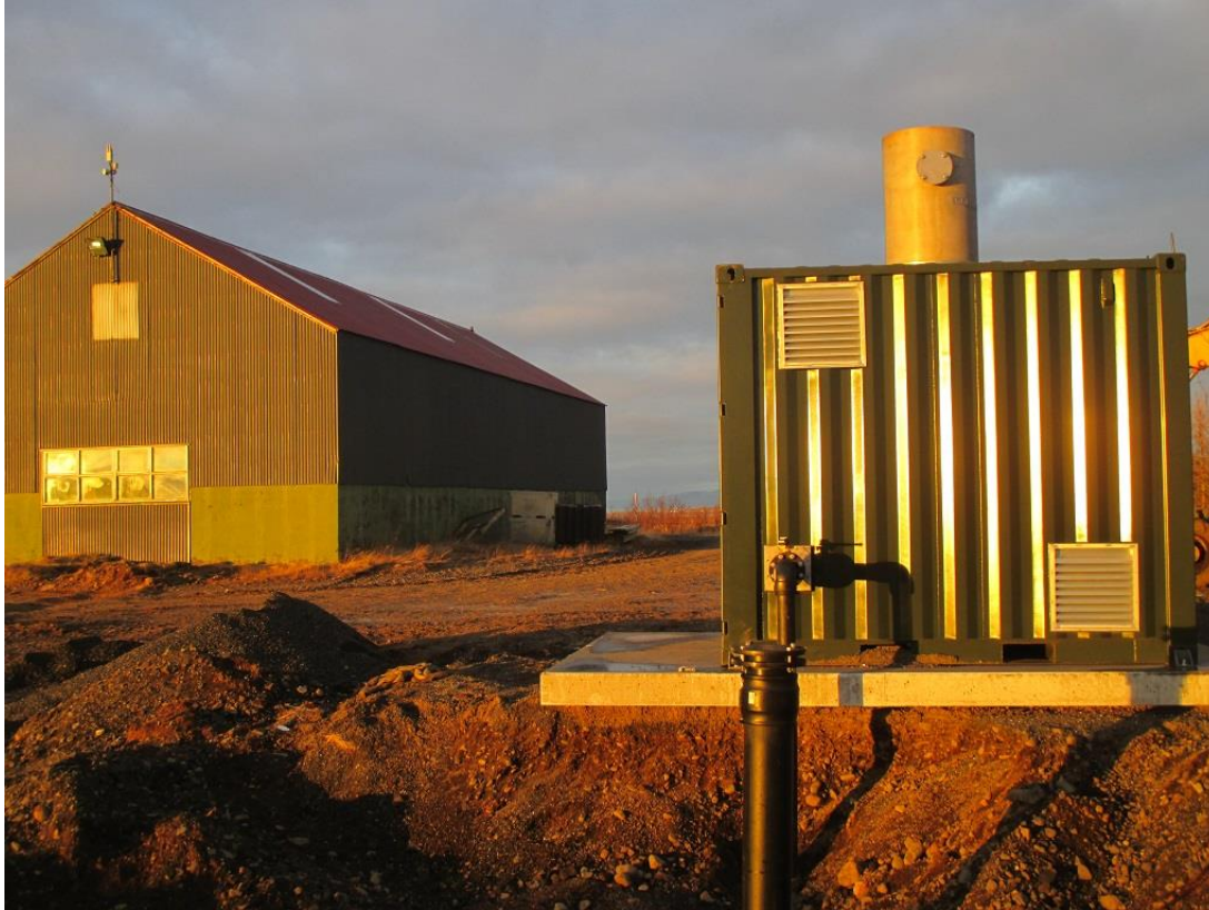
Mynd 2. Gasbrennslukyndill í Fíflholtum 26. nóvember 2018.